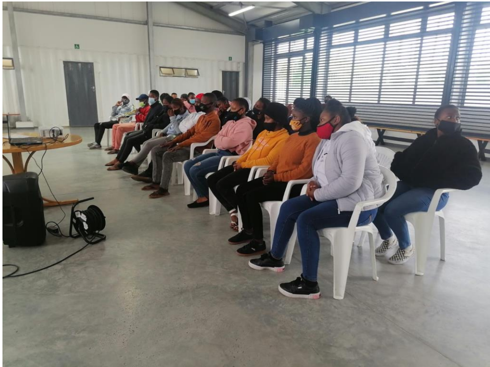
Volgen online training