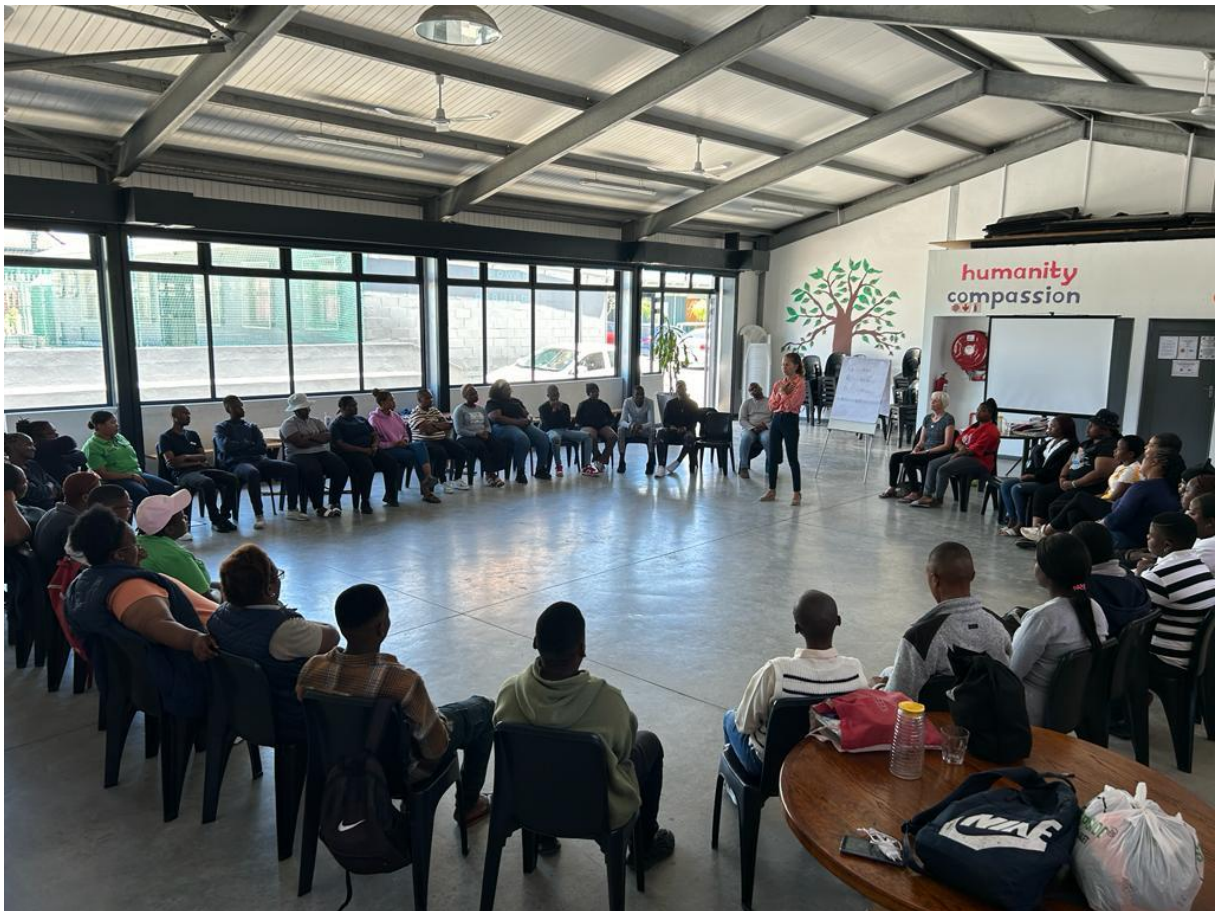
Jongeren in training