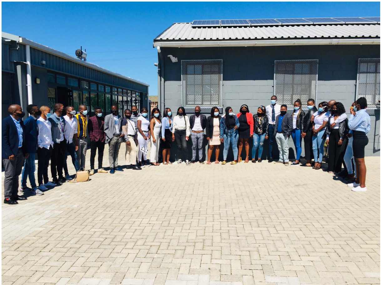
Groep in Youth Centre Khayelitsha