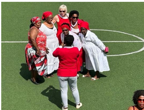
Dress code rood wit

Op 1 december is het Wereld Aids dag, iets waar bij Yabonga altijd aandacht aan wordt besteed. Zo ook deze vrijdag, waarbij er diverse speeches gehouden werden, onder andere door ervaringsdeskundigen. Opvallend zijn de sterke Afrikaanse vrouwen die de boel bij elkaar houden, ondanks de enorme uitdagingen waar ze voor staan, zoals discriminatie als ze HIV/Aids hebben. (Ik denk dan wel eens aan de uitspraak: mannen voeren oorlog, maar de vrouwen winnen). Drie kaarsen werden tijdens de herdenking gebrand, waarvan één voor de vele overledenen.