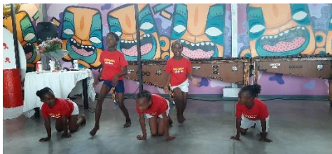
25 jaar Yabonga

Op 1 december waren we bij het feest dat Yabonga organiseerde naar aanleiding van het 25-jarig bestaan. Tegelijkertijd werd stil gestaan bij Wereld Aids Dag. De zaal in het Jeugd Centrum was prachtig ingericht: tafels feestelijk gedekt voor het eten, in de kleuren rood en wit die bij het 'Aids strikje' passen. De dress code was ook wit met rood, het zag er prachtig uit. We kregen diverse topvoorstellingen te zien, met zang, dans en marimba. De kinderen zijn zo ontroerend! Daarna werd iedereen beloond met een heerlijke maaltijd! Voor een impressie van het feest klik hier .