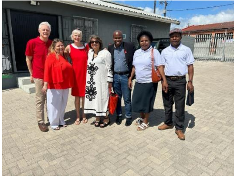
Oprichter, trainers en facilitators