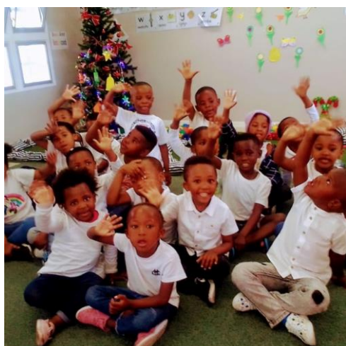
Support aan jongere kinderen

De groep jongeren van 2022 bestaat nu uit 40 mentors, een prachtig aantal! En uiteraard zijn ze volop bezig met hun persoonlijke ontwikkeling, hun toekomst en hun werk als mentoren van de jonge kinderen van Yabonga. Deze kwetsbare jonge kinderen krijgen support in spel, huiswerk en overige begeleiding. Zij gaan drie keer per week na schooltijd naar huizen van 'Community Mothers' waar ze ook een maaltijd krijgen. De mentoren begeleiden de kinderen en doen zo iets terug voor de gemeenschap en Yabonga.