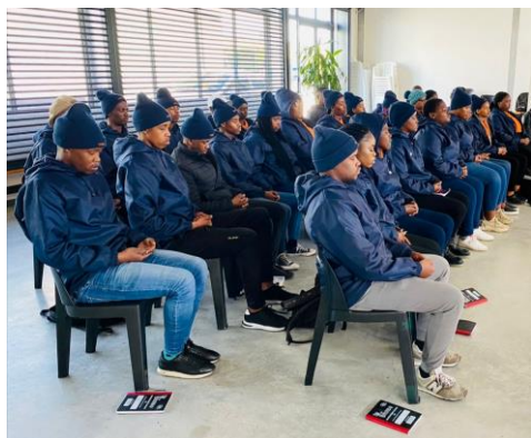
De jongeren in meditatie

In de eerste week van juli hebben we aan de tweede groep mentors een paar dagen online empowermenttraining gegeven. Door middel van lezingen, context geven en verdere begeleiding, heeft de groep van 20 jongeren in Wellington een mooie boost in hun ontwikkeling gekregen. Gelukkig was de internetverbinding goed, behalve op de laatste dag toen de hele groep weer bij elkaar was. Wijzelf waren in de Verenigde Staten en hadden te maken met een groot tijdsverschil. Desondanks waren we aan beide zijden tevreden met het resultaat.