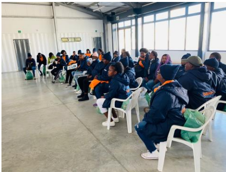
Samenkomst voor online sessie