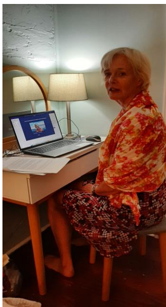
Vanuit de USA