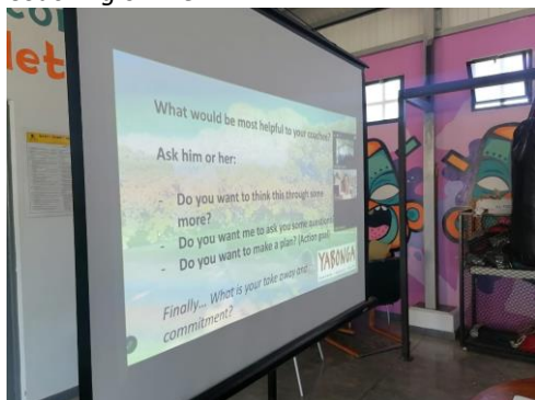
Intro Coaching online