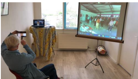
Werkruimte in Houten