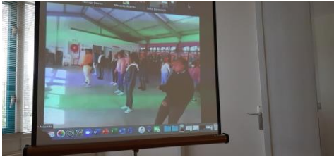
Body awareness op afstand