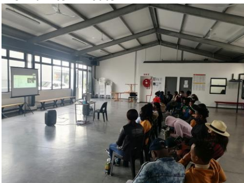
Werkruimte in het Jeugdcentrum in Kaapstad