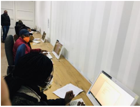
Met mondkapjes op