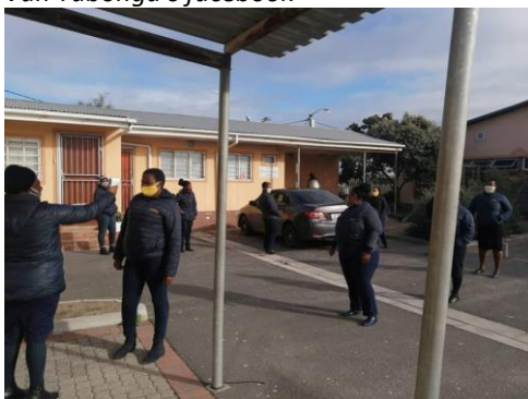
Temperatuur testen bij het jeugdcentrum