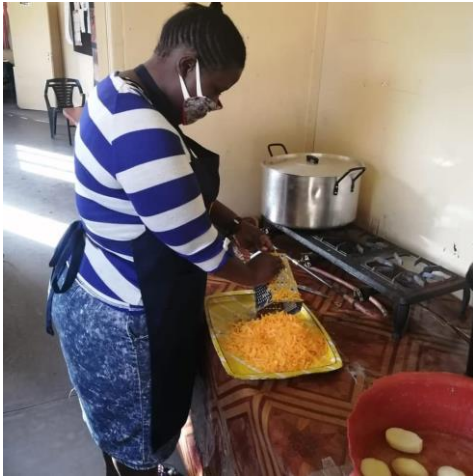
Eten koken voor de kinderen