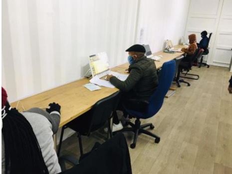
Op afstand aan het werk

heeft weer een bijdrage geleverd met haar online muziek. Yabonga Nederland is dankbaar voor alle gulle gevers !