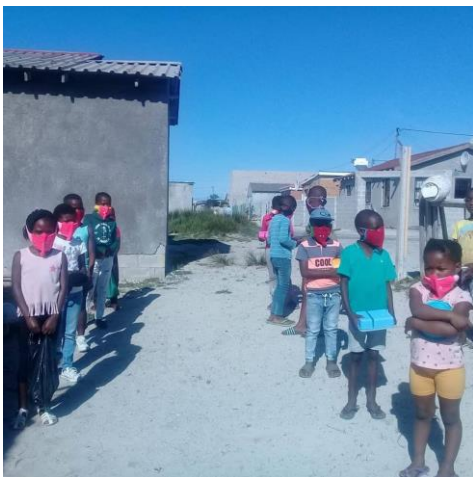
Kinderen in de rij