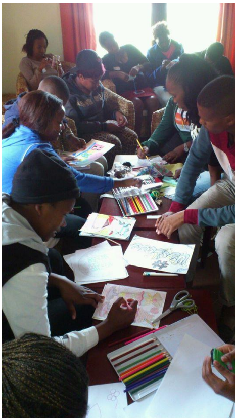
Empowerment training met kunst

Je kunt een e-mail sturen naar i.dorresteijn@ziggo.nl als je deze nieuwsbrief niet meer wilt ontvangen.