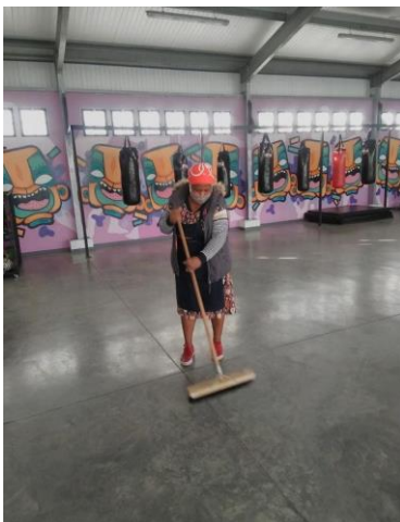
Extra schoonmaken in het jeugdcentrum