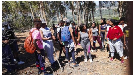
Eind november wandeling in de bergen bij Wellington