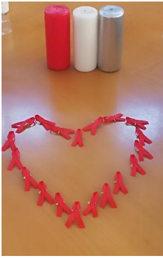
Bijeenkomst WAD Yabonga

In een bijeenkomst werd stilgestaan bij degenen die er niet meer zijn vanwege HIV/Aids, degenen die positief zijn (hun status kennen, noemen ze dat) en degenen die hun status niet kennen, maar wel HIV hebben. Ook wij van Yabonga Nederland hebben daar een moment bij stilgestaan en een kaars aangestoken. Aids is nog steeds een groot probleem in Zuid Afrika, vooral in de arme gebieden. De gemiddelde levensverwachting is mede door Aids 54 jaar ! Elk jaar sterven door de ziekte honderdduizenden mensen in Zuid Afrika, daarmee valt Covid-19 bijna in het niet (zie cijfers links onder).