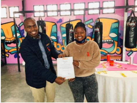
Manqoba (links) reikt certificaat uit