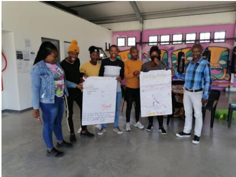
Dank je wel posters voor Manqoba