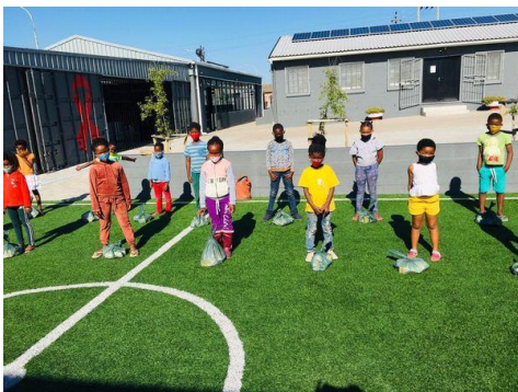
Kinderen sporten met mondkapjes op