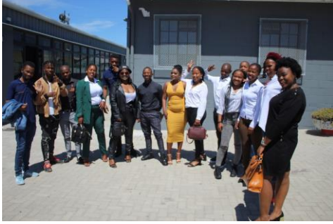
Voor het vertrek naar Wellington