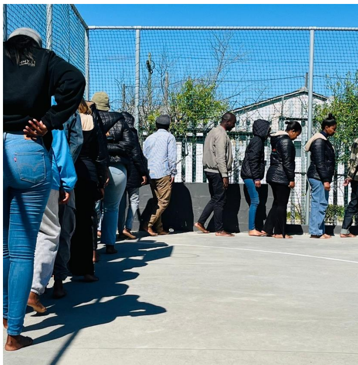
Stiltewandeling in het jeugdcentrum

De Stichting Yabonga Nederland baseert de gevraagde gelden op de directe kosten die in Zuid-Afrika ten behoeve van de jongeren van Yabonga worden gemaakt. Dat zijn de kosten voor lessen, workshops, onderdak, catering, transport en leermiddelen voor zo'n 50 jongeren. Daarbij komt 350 euro schoolgeld per leerling, bij inschrijving van een vervolgopleiding, voor een zo groot mogelijk aantal studenten. Kosten zijn er ook voor het opstarten van kleine bedrijfjes die de jongeren willen beginnen. En ze krijgen een kleine toelage voor hun werk met de jongere kinderen en ter bestrijding van armoedige omstandigheden, die zijn toegenomen door sterke inflatie, werkloosheid en Covid.