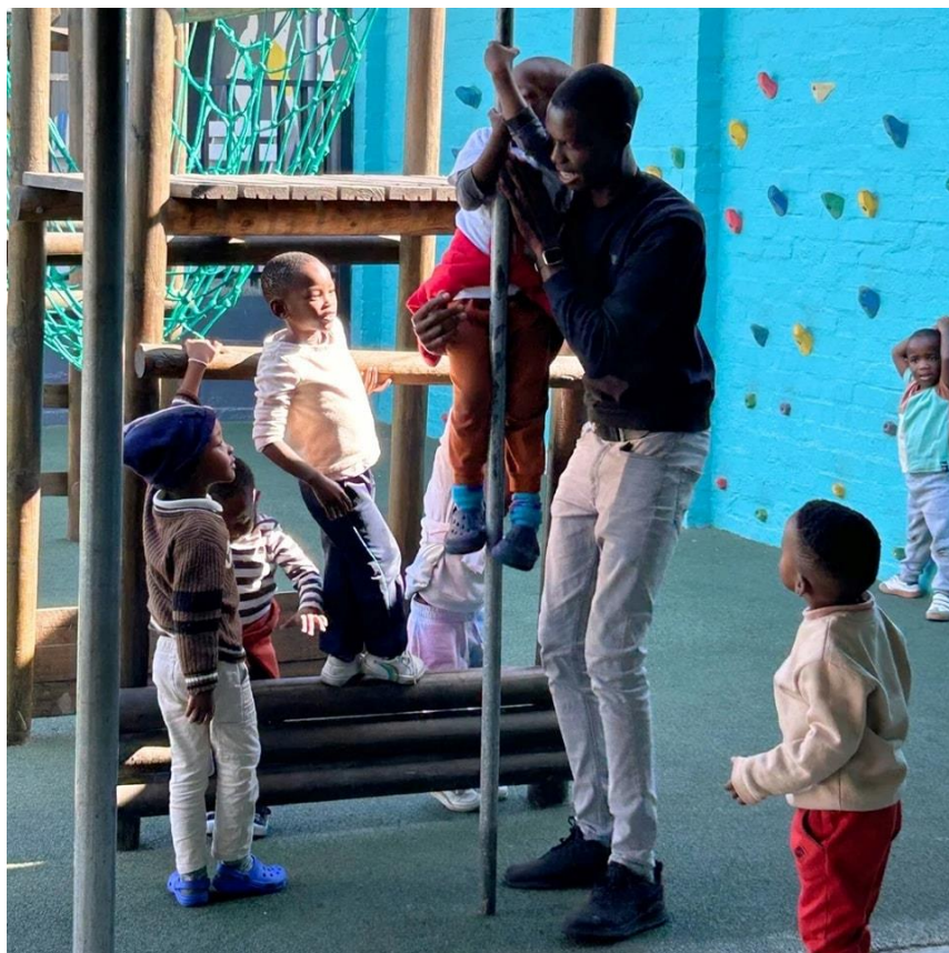
Mentor aan het werk met jongere kinderen

Adres: Yabonga ZA, 23 Cecil Road, Plumstead, South Africa